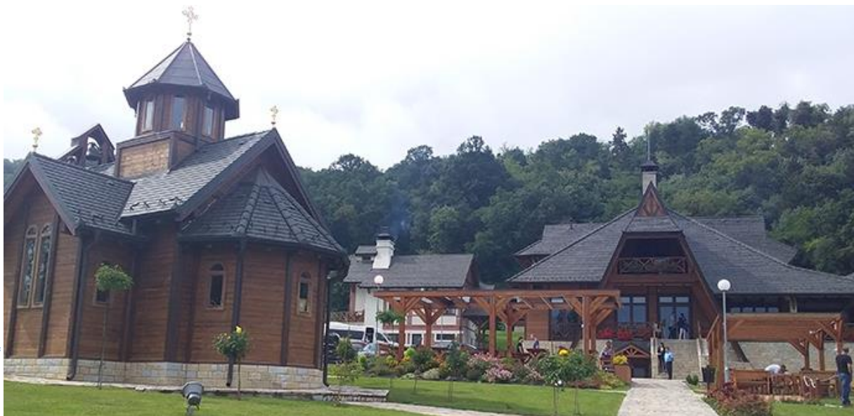
Бела Црква – Блажево Јул, 2018.